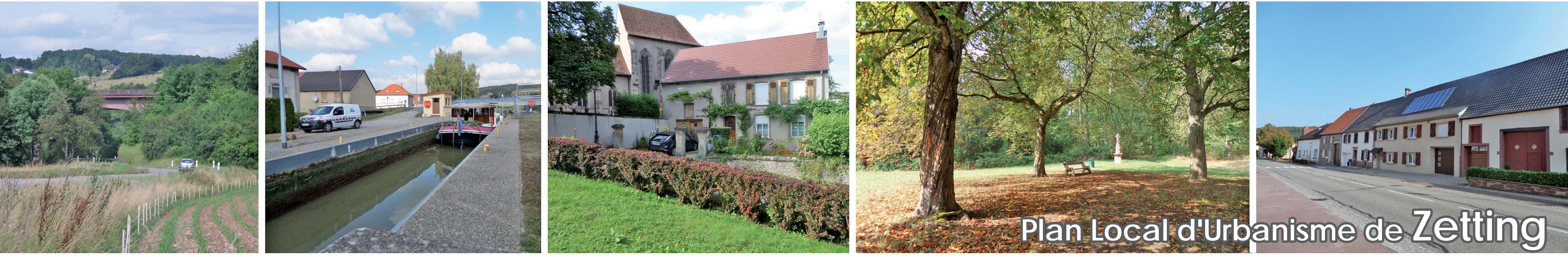
Plan Local d'Urbanisme de Zetting

Le Plan Local d'Urbanisme est un document d'urbanisme qui régit les droits à construire sur l'ensemble du territoire communal. Il envisage l'avenir de la commune et doit permettre la réalisation du projet urbain communal. Il répond à l'objectif suivant :